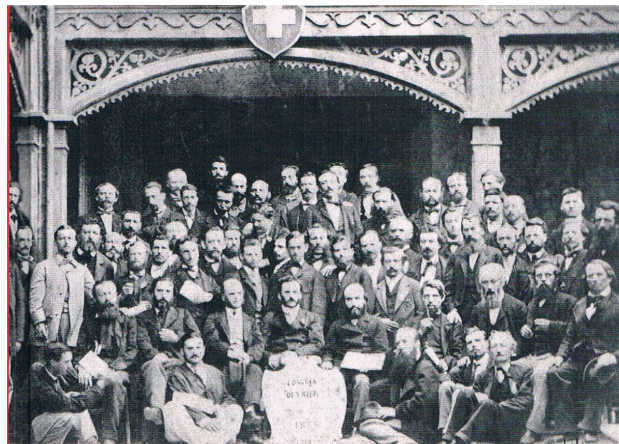
1er congrès de l'Association Internationale des Travailleurs Genève septembre 1866

Un certain nombre d'événements rappelleront cette histoire dans plusieurs endroits. Pour sa part, la "Coopérative Audio Visuelle d'Entraide" (CAVE) de La Chaux-de-Fonds, « Signe Productions » de Delémont et la « Coopérative Espace Noir » à St-Imier ont l'intention de réaliser un documentaire sur la Fédération jurassienne.